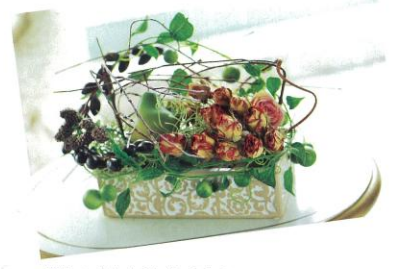
グリーンをたくさん使ったナチュ ラルなアレンジは、見ているとほ っとした気持ちに。